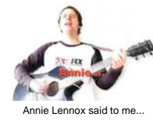
Annie Lennox said to me...